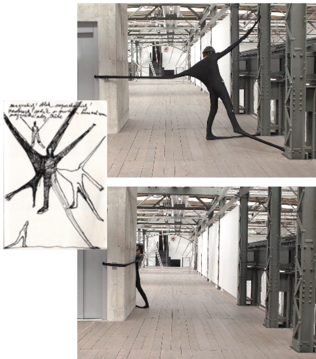
Milada , videoperformance, elastický oděv, neodymové magnety, 2019 Milada , videoperformance, elastic clothing, neodymium magnets, 2019